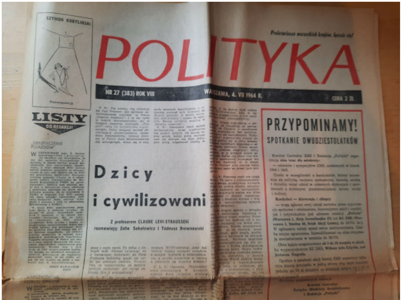
Wywiad z Claude Lévi-Straussem, 1964