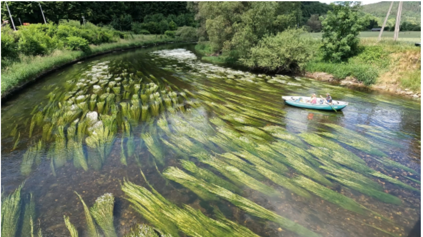
Bóbr, Wle?, zakwit jaskrów wodnych