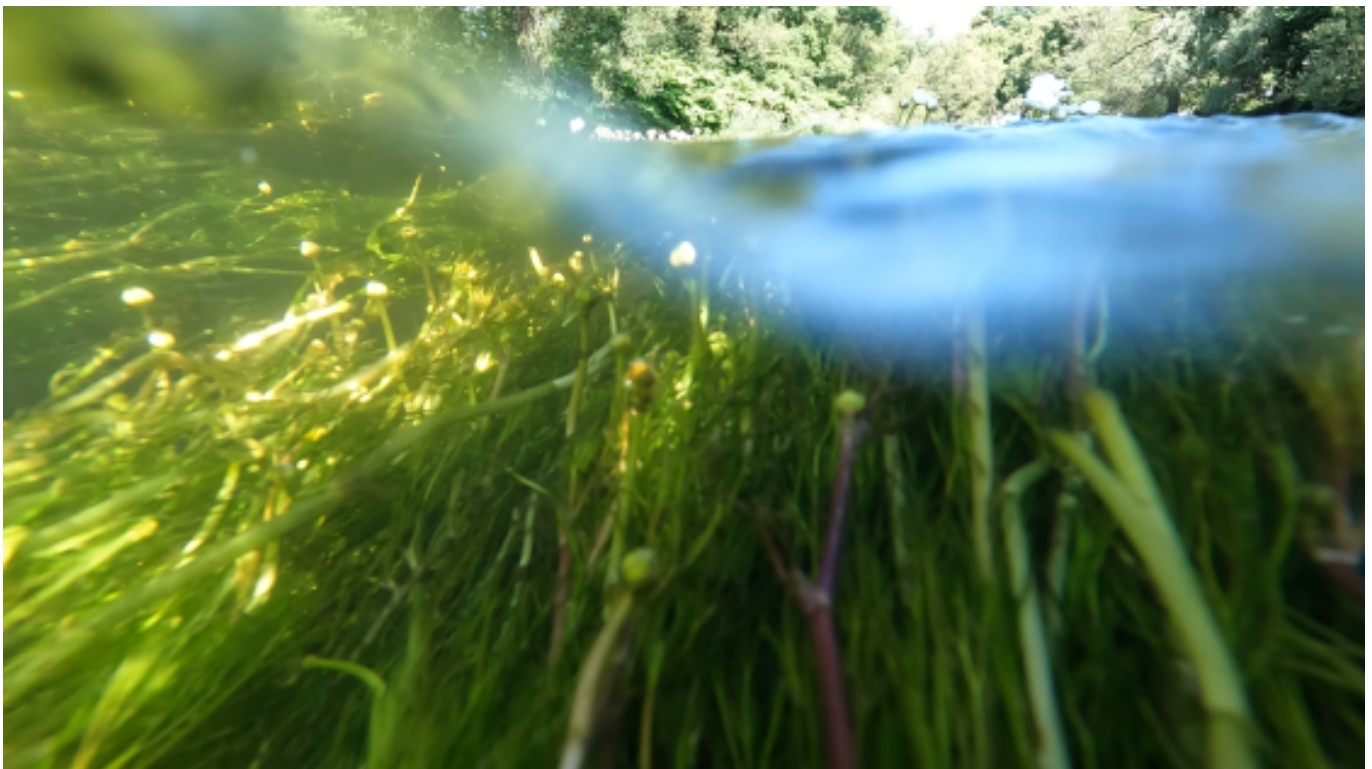
Jaskry wodne na granicy wody, Bóbr

Zlewnia Bobru na terenie gminy Wle? to obszar przemys?owy z rozbudowan? infrastruktur? hydrotechniczn? (zaporami, elektrowniami wodnymi, jazami). We wsi Pilchowice znajduje si? Zapora Pilchowicka - najwy?sza zapora kamienna i ?ukowa na terenie wsp?oczesnej Polski. Powsta?a w latach 1902–1912 w celu ochrony przed powodziami. Impulsem do jej powstania, w ramach szerszego planu przeciwpowodziowego ówczesnego Cesarstwa Niemieckiego, by?a powód? z 1897 r. W tym terenie uwidacznia si? jak hydroin?ynieria i hydropolityki