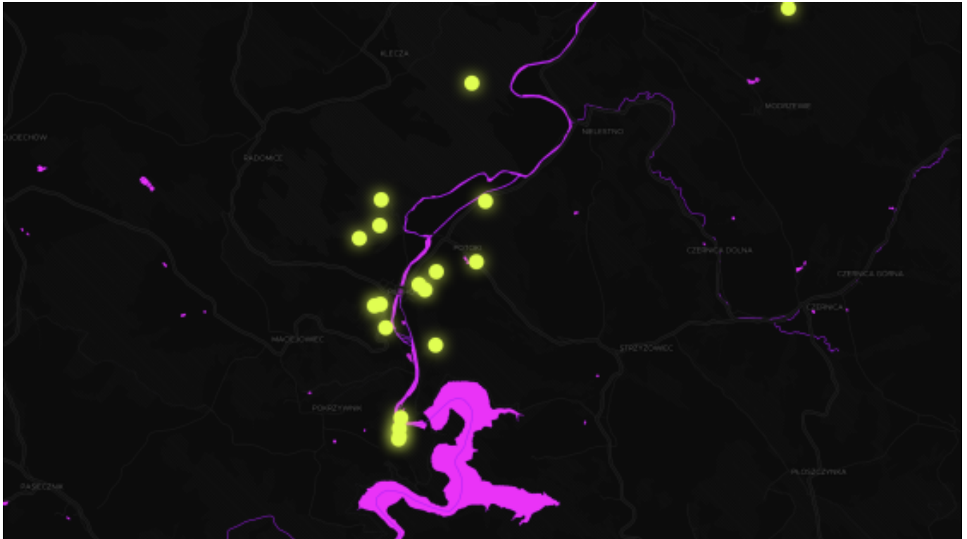
PoWody - interaktywna mapa poniemieckich studni