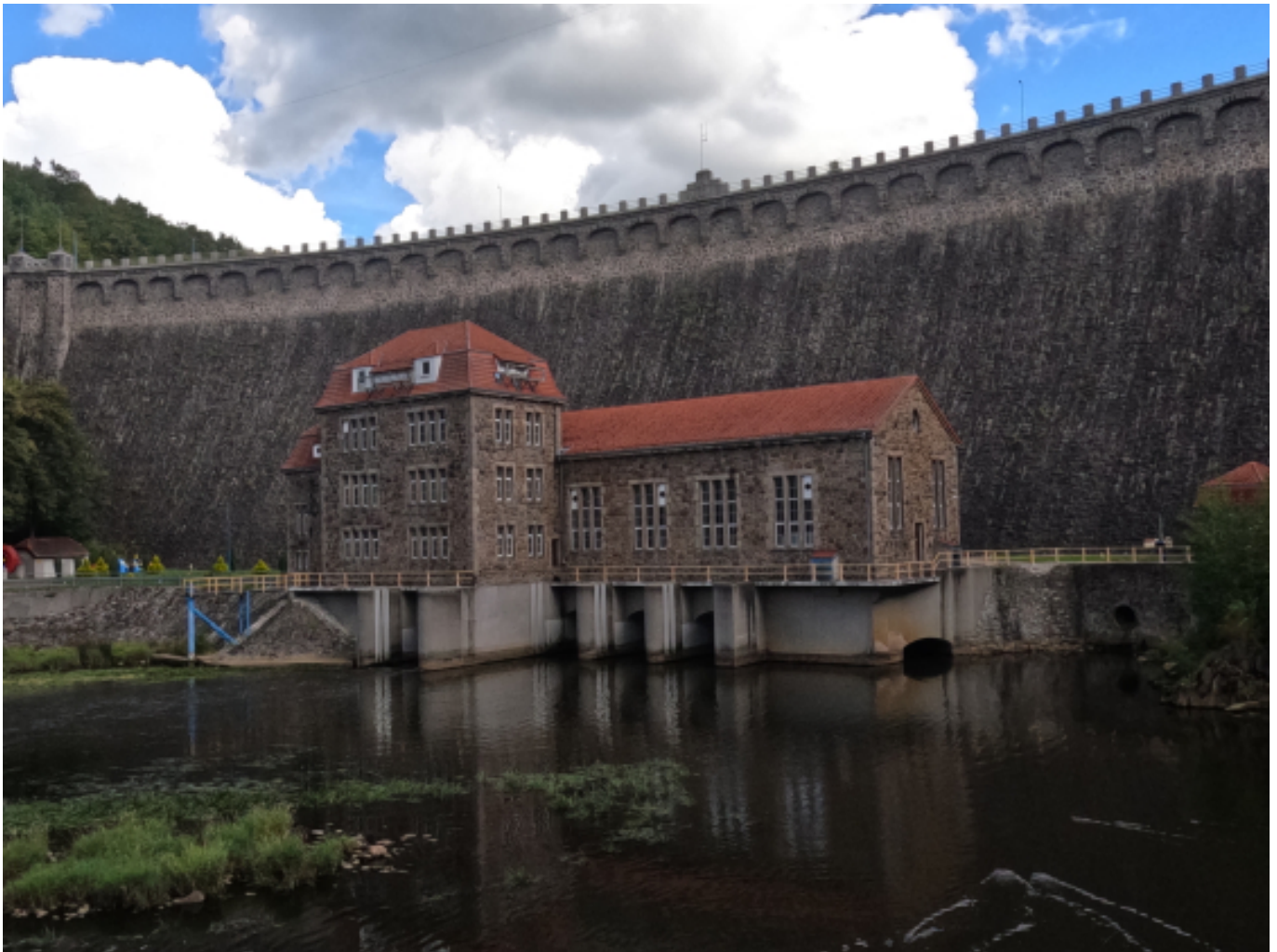
Bóbr, Tama w Pilchowicach