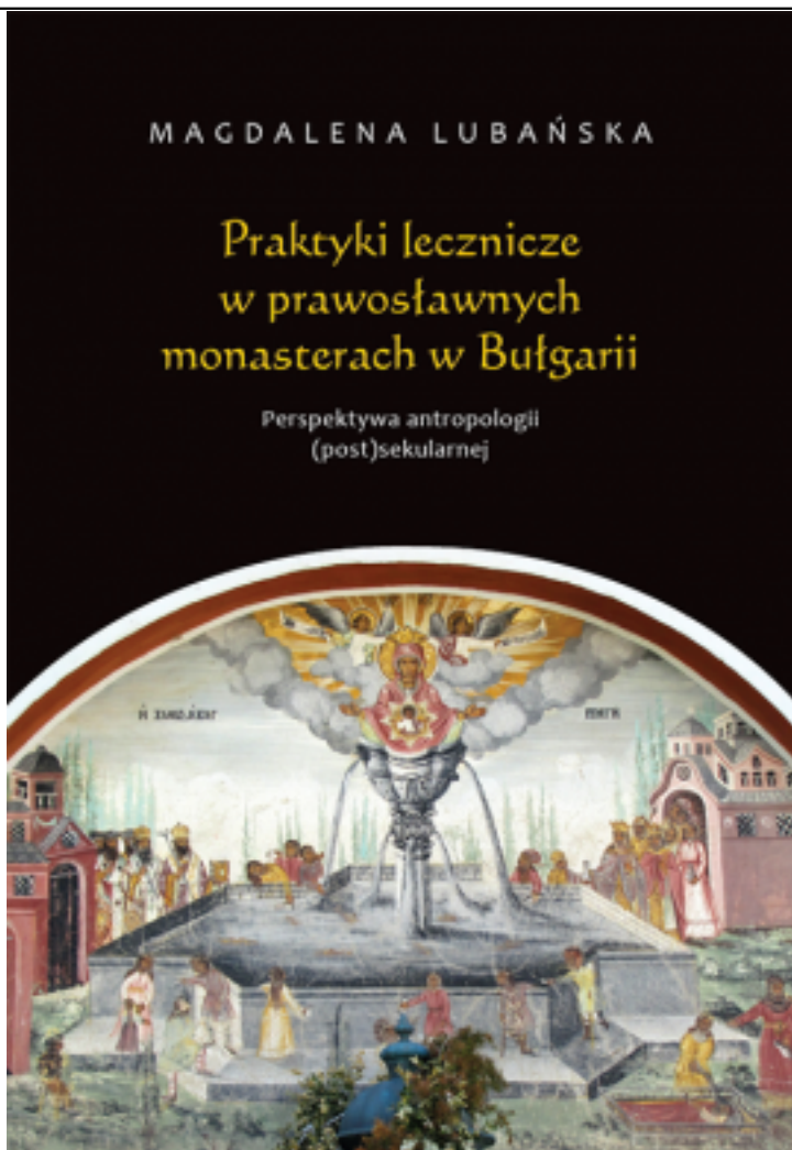
Praktyki lecznicze w prawosławnych monasterach w Bułgarii. Perspektywa antropologii (post)sekularnej, Warszawa: WUW, 2019